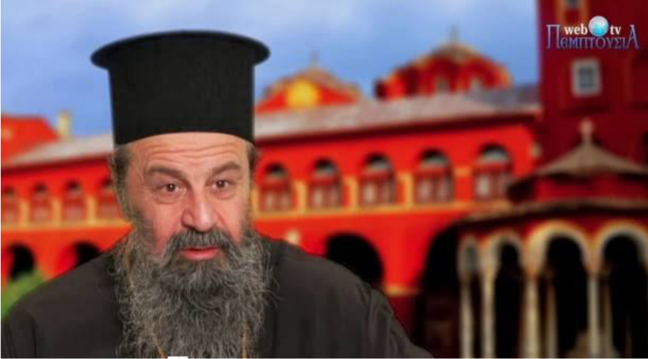
του Σεβασμιωτάτου Μητροπολίτου Δράμας κ. Παύλου

Ο πανίερος ναός της του Θεού Σοφίας στην Κωνσταντινούπολη είναι τό σέμνωμα και τό καύχημα της Ρωμανίας και της κατ' Ανατολάς Ὁρθοδόξου Ἐκκλησίας.